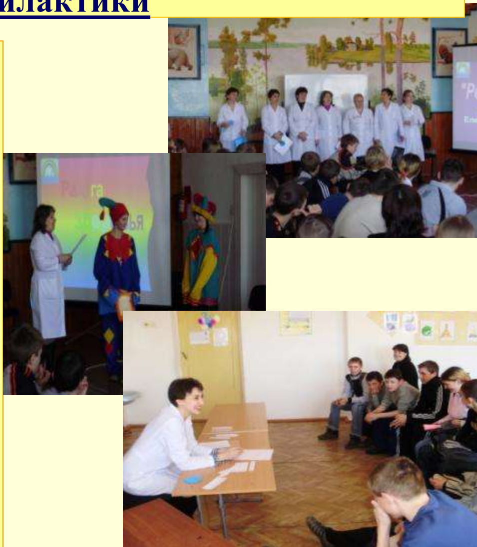
Праздник «Радуга здоровья» - МУЗ «Молчановская ЦРБ»